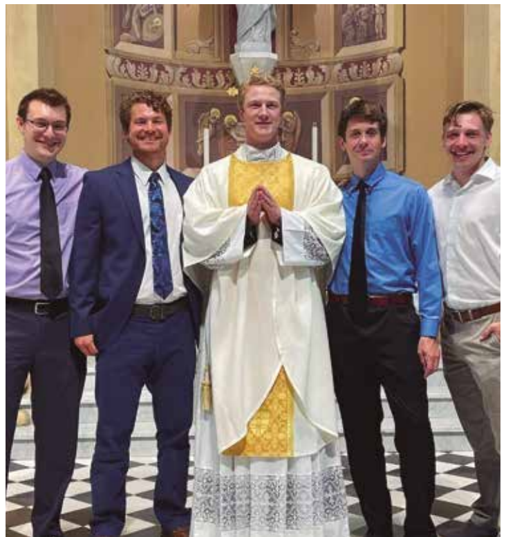
D. Peter con jóvenes en la parroquia del Sagrado Corazón en Lewistown.