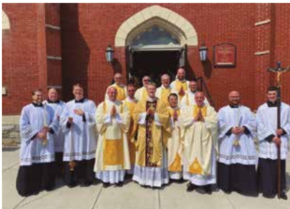
D. Peter tras la santa Misa en la parroquia de la diócesis de Harrisburg.

Lee la historia completa en www.carfundacion.org